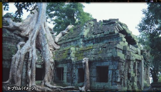
タ・プロム(イメージ)

アプサラダンス・ディナーショー鑑賞や郷土料理など 内容盛りだくさんの5日間です。