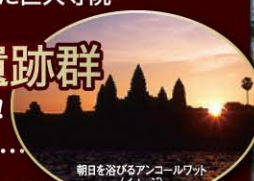
朝日を浴びるアコールワット(イメージ)