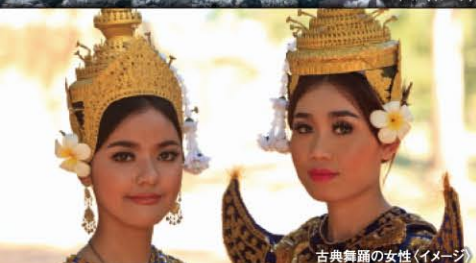
古典舞踊の女性(イメージ)