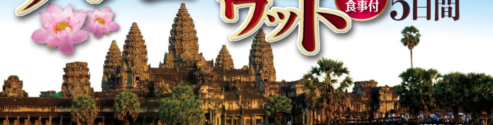
世界遺産・アコールワット(イメージ)