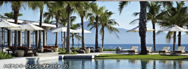
ハイアットリージェンシー ダナン(イメージ)