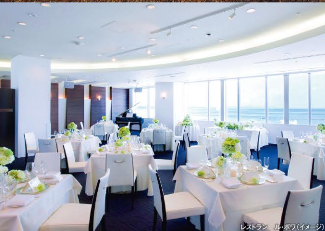
レストラン ル・ボワ(イメージ)