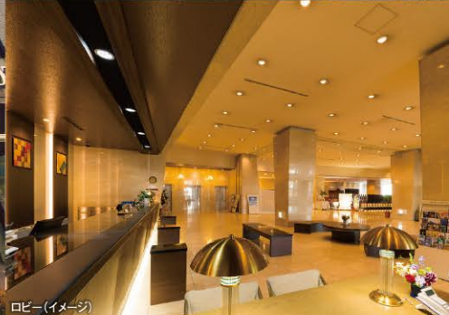
外観(イメージ) ロビー(イメージ)