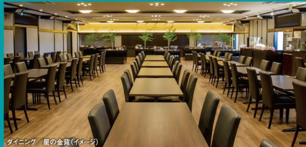
ダイニング/星の金貨(イメージ)

ご到着からご出発まで、 心を込めたおもてなしと笑顔のサービスを心がけております。 お子様向けイベントも大人気!!