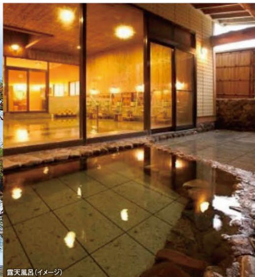
露天風呂(イメージ)