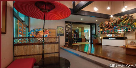
玄関ホール(イメージ)

四季折々魅力あふれる津軽路の旅、花と畳を愛する宿 穏やかに流れる時の中で、ちょっと贅沢なひとときをお過ごしください。