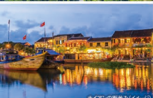
ホイアンの街並み(イメージ)