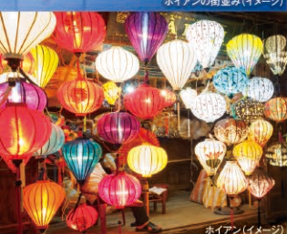
ホイアン(イメージ)