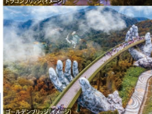
ゴールデンブリッジ(イメージ)