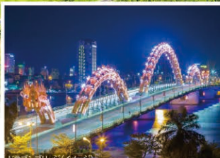
ドラゴンブリッジ(イメージ)