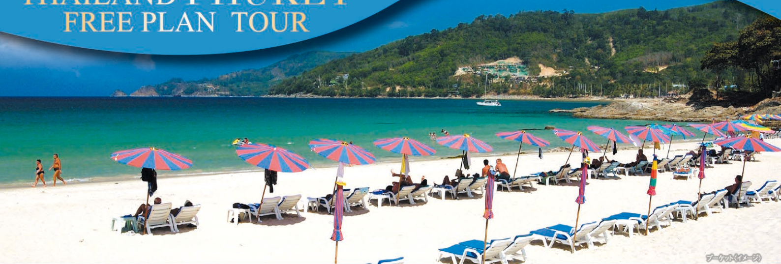
プーケット(イメージ)