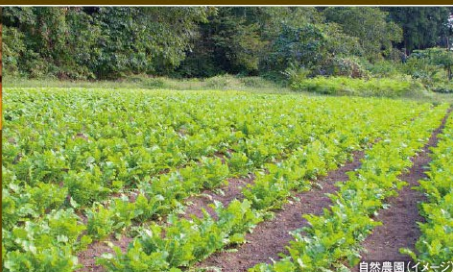
自然農園(イメージ)

自然の恵みの「安心・安全・美味しい」の農産物をお客様にお出ししたいとの願いから、約20年前に自家農場での栽培を思いました。ご宿泊のお客様の夕食に使用しております。