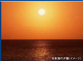
日本海の夕陽(イメージ)

松林越しに雄大な白浜の日本海と夕陽を望む、最高のロケーションを誇ります。その日その日で違う顔を見せる日本海と黒松林のコントラストはまさに絶景です。お食事は、とれたての新鮮な旬の幸をご用意しております。森林浴も楽しめる開放感満天の露天風呂や日本海の大パノラマを一望できる展望風呂などを存分にお楽しみください。