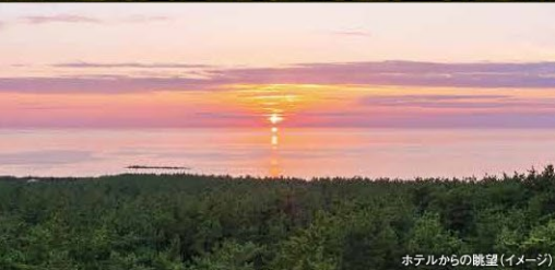
ホテルからの眺望(イメージ)