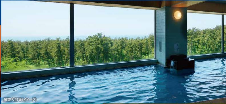
展望大浴場(イメージ)