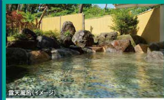
露天風呂(イメージ)