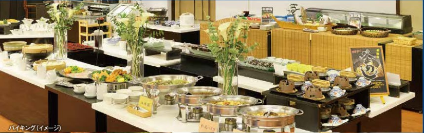
バイキング(イメージ)