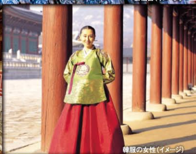
韓服の女性(イメージ)