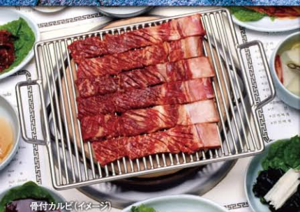
骨付カルビ(イメージ)