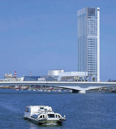
日本海を一望できるお部屋!!

訪れるたびに、変わらない安心に包まれる。 訪れるたびに、新しい快適が楽しめる。 そんな安らぎに満たされる上質な時間です。