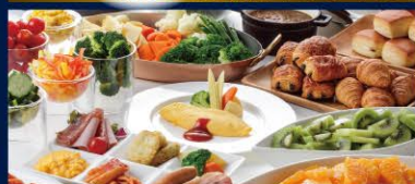
和洋バイキング(イメージ)