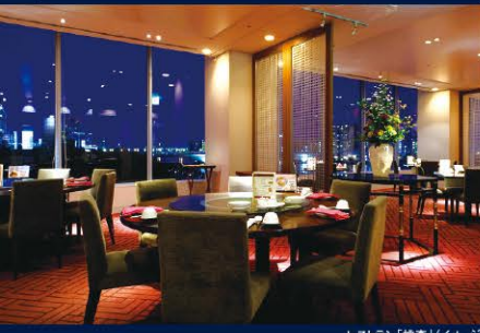
レストラン「桃李」(イメージ)