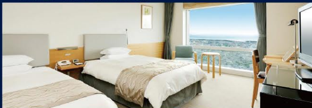
お部屋タイプの一例(2~3名様1室) ※1名1室ご利用時のお部屋は写真と異なります。

お車で お越しの お客様には 1室につき1台 駐車場(普通車)1泊 ※入庫から21時間 無料 サービス!!