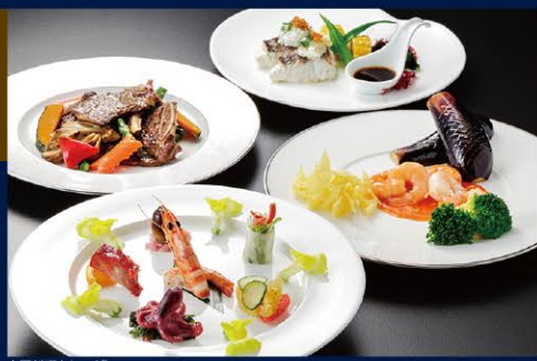
中国料理(イメージ)

夕食のご予約時刻は18:30とさせていただきます。 ※変更ご希望の場合は予約時にお申し出ください。