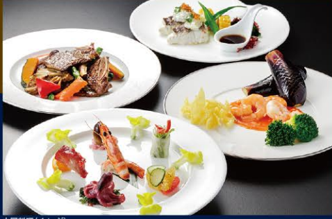
中国料理(イメージ)

雄大な信濃川を望む店内で、 広東料理を中心とした 「桃李」の中国料理 を お楽しみください。