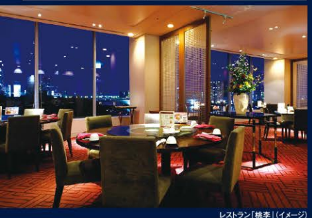
レストラン「桃李」(イメージ)