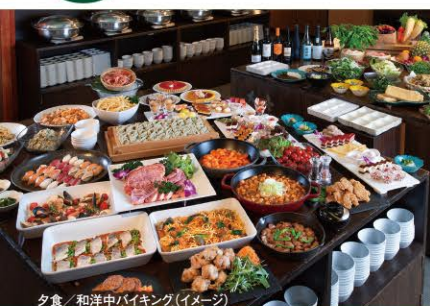
夕食/和洋中バイキング(イメージ)