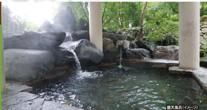
露天風呂(イメージ)