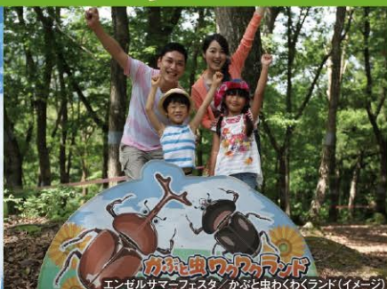
エンゼルサマーフェスタ/かぶと虫わくわくランド(イメージ)

豊かな自然に囲まれるこの場所で、家族の思い出をつくりませんか。庭園の一角に配した露天風呂やサウナが完備された本館大浴場に加え、温水プール、スポーツジム、テニスコート、卓球場などがあります。充実した施設でリゾートを満喫してください。