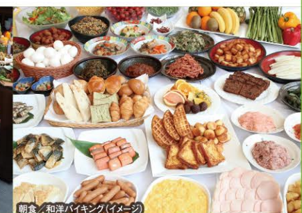
朝食/和洋バイキング(イメージ)