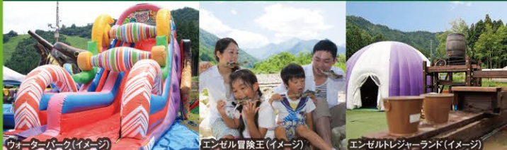
ウォーターパーク(イメージ)