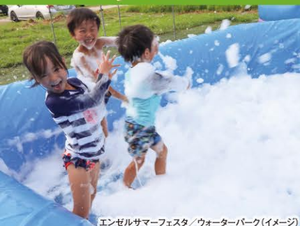
エンゼルサマーフェスタ/ウォーターパーク(イメージ)