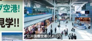
仁川国際空港(イメージ)

2 2日目は 韓国の空の玄関口! 世界有数のハブ空港! 仁川国際空港 をたっぷり見学!! アジアナ航空格納庫 機体整備工場見学など、 普段は観ることのできない 制限区域にも入場・視察!!