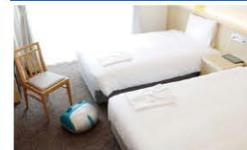
ファイテンルーム ツイン 18.75~21.83㎡