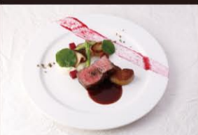
フレンチ ディナー (イメージ) ※実際の料理とは異なる場合がございます。

【ご注意】お客様事情にて朝食および夕食をお召し上がりいただかなかった場合でも、ご返金等とはございません。予めご了承ください。