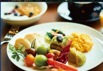
朝食(イメージ) ※実際のメニューとは異なる場合がございます。

朝食 セットメニュー 06:30~10:00(09:45までにご入店) ※当面の間ビュッフェを休止いたします。 ※メニューは変更になる場合がございます