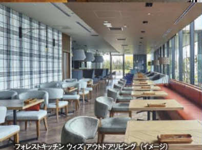
フォレストキッチン ウィズ アウトドアリビング (イメージ)

木を基調とした店内の“バー、メインダイニング、プライベートダイニング、テラスダイニング、アウトドアリビング”という5つのゾーニングで、ラグジュアリーな「居心地の良い大人の遊び場」を演出しています。