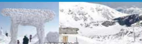
雪化粧の御釜(イメージ)

3月中旬開催の特別限定ツアー!雪と氷で雪化粧をした蔵王のシンボル「御釜」と、刈田岳山頂「刈田神社」奥宮を鑑賞いただけるツアーです。 ●10:30出発~12:50戻り ●13:30出発~15:50戻り (各便 所要約2時間20分) ●スタンダードクラス 御釜鑑賞ポイントまで片道約55分 ⇒ 散策約30分 ⇒ すみかわスノーパークまで約55分