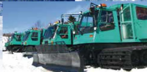
ワイルドモンスター号(イメージ)

スタンダードクラス/レストハウスにて受付 スケジュール ●11:00出発~13:00戻り ●13:30出発~15:30戻り