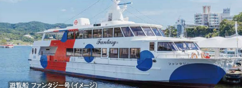
遊覧船 ファンタジー号(イメージ)