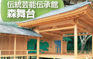
森舞台(イメージ)

明治21年(1888年)に落成した旧登米高等尋常小学校。国の重要文化財に指定されています。