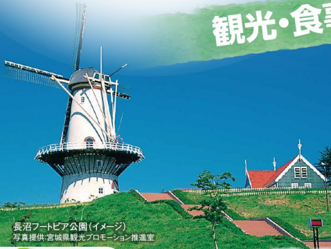
長沼フットピア公園(イメージ)