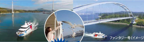
気仙沼PIER7(イメージ) ファンタジー号(イメージ)

今年3月に開通した気仙沼湾横断橋と大島大橋の2つの橋をくぐる気仙沼ベイクルーズもお楽しみいただけます。