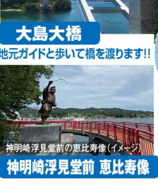
神明崎浮見堂前 恵比寿像(イメージ) 神明崎浮見堂前 恵比寿像