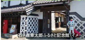
石ノ森章太郎ふるさと記念館(イメージ)