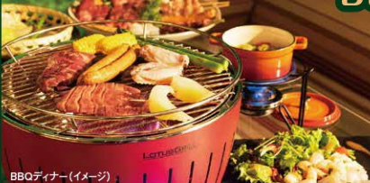
BBQディナー(イメージ)

オープンエアな空間でアウト ドアを気軽に酒落に満喫 するBBQディナー。解放感 溢れるガーデンテラスで、夏 リゾートをお楽しみください。