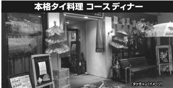
タアチャン(イメージ)