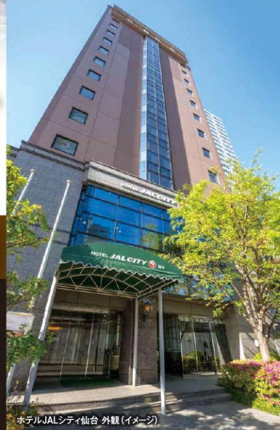
ホテルJALシティ仙台 外観(イメージ)