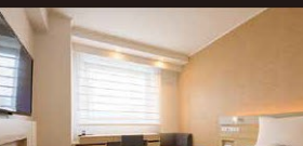
お部屋の一例/シングルルーム(イメージ)

広さ17㎡/ベッド幅140cm 1台 全室140cm幅のセミダブルベッドで、ゆとりある広さのシングルルーム。ライティングデスクを備え、使い勝手の良いお部屋です。