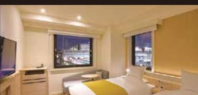
お部屋の一例/ツインルーム(イメージ)

広さ21㎡/ベッド幅110cm 2台 幅110cmのベッドが2台の、空間に余裕を持たせたツインルームはご夫婦やご友人同士のご旅行に最適です。