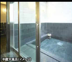
半露天風呂(イメージ)

最上階には、宿泊者専用大浴場を男性用女性用それぞれにご用意しております。心と体をときほぐし、深くくつろぎをご堪能ください。