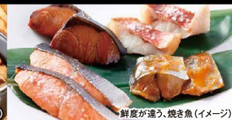
鮮度が違う、焼き魚(イメージ)