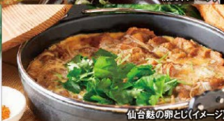
仙台麺の卵とじ(イメージ)