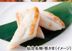
仙台名物・笹かま(イメージ)