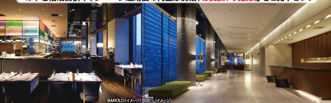
BAROLO(イメージ) ロビー(イメージ)