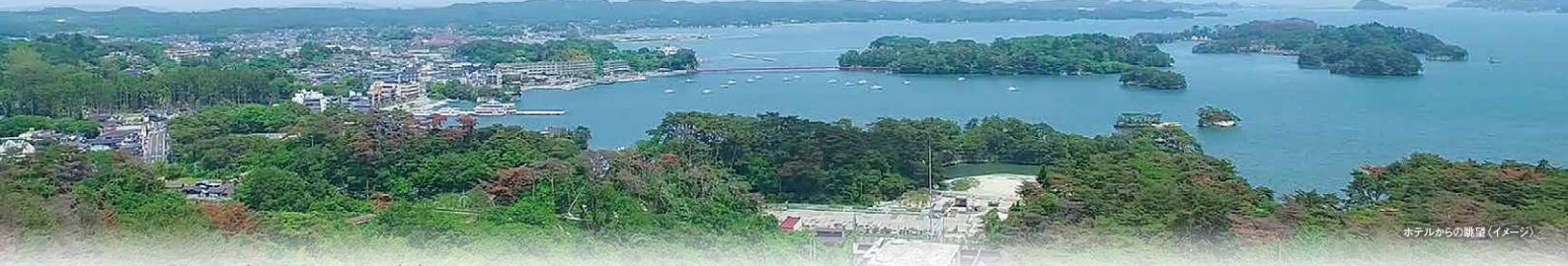
ホテルからの眺望(イメージ)