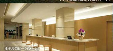
ホテルロビー(イメージ)

豊かな自然に囲まれた松島のリゾートホテル「ホテル松島 大観荘」。 日本三景・松島湾を眺望できる開放感あふれる露天風呂や 地元宮城の旬の素材を使った料理をご堪能いただけます。 壮大な景色と広々とした客室で、癒しのひと時をお愉しみください。