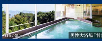
判官の湯(イメージ)