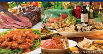
夕食・朝食会場「ラ・セレーヌ」1F ※会場が変更となる場合がございます。