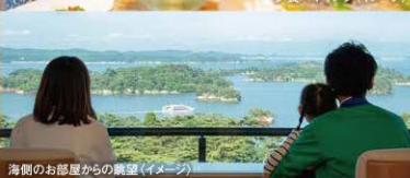
海側のお部屋からの眺望(イメージ)