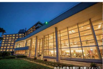
ホテル松島大観荘 外観(イメージ)

日本三景・松島の壮大で美しいロケーション。 大観荘ならではの"おもてなし"がここに 있습니다。