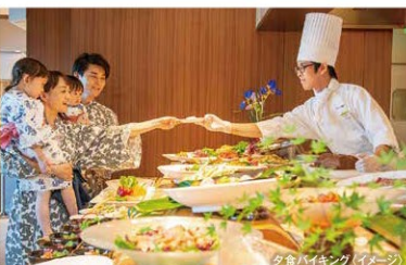
夕食バイキング(イメージ)