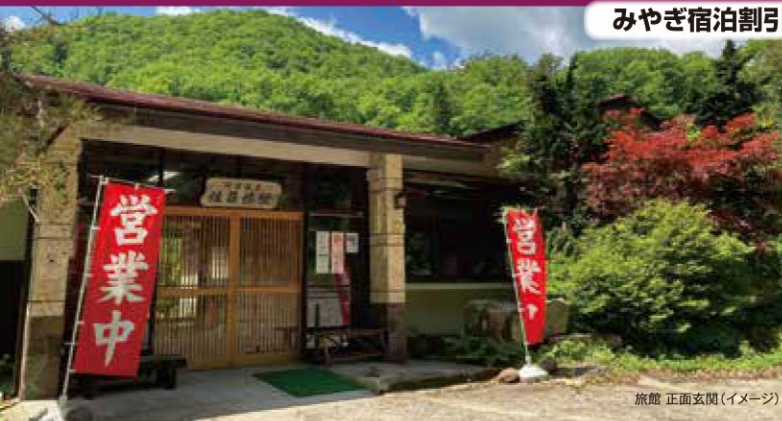
旅館 正面玄関(イメージ)

宮城県屈指の歴史ある“秘湯”が復活。 2021年4月よりご宿泊サービスを再開!!