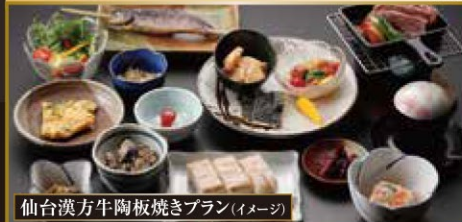
仙台漢方牛陶板焼きプラン(イメージ)

※追加代金にて、下記2プランのどちらかで希望のお食事がお選びいただけます。(追加代金は裏面をご覧ください。)