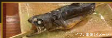
イワナ串焼(イメージ)

100%源泉かけ流しでございます。 泉質:ナトリウム 塩化物泉(低張性弱アルカリ性高温泉) 泉温:64.4℃ 浴槽内43.3℃