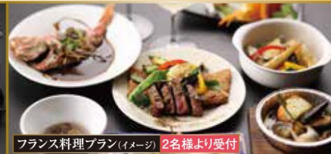
フランス料理プラン(イメージ) 2名様より受付