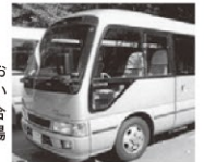
送迎バス(イメージ)

※前日15時までのご予約となりますのでご希望のお客様はご連絡ください。※満席になり次第受付を終了いたします。※発車時刻に遅れてご乗車できなかった場合はその責任を負いかねます。時間に余裕を持って乗車場所までお越しいただきますようお願いいたします。