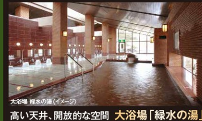
大浴場 緑水の湯(イメージ)

土地の広さを活かして設けられた露天風呂 「篝火の湯」。大浴場から離れたことにより、単 なる「露天」だけではなく、大自然に囲まれた 露天風呂本来の趣を実現しております。当館自 慢の自家源泉をじっくりとご堪能ください。