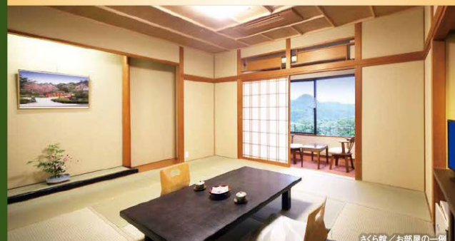
さくら館/お部屋の一例

心地よい山あいの風、そよぐ木々と小鳥のさえずり。窓の外に広がる 秋保の自然豊かな景色が最高のおもてなし。特徴豊かなお部屋 で、特別なひとときをお過ごしください。〈部屋指定なし〉