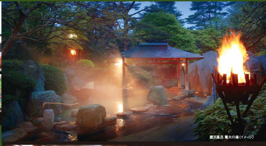
露天風呂 篝火の湯(イメージ)