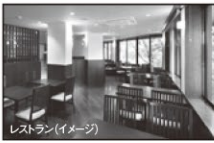
レストラン(イメージ)

〈ご注意〉ご予約後、お客様事情でお食事をお召し上がりいただけなかった場合でもご返金等はありません。予めご了承ください。