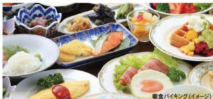
朝食バイキング(イメージ)

地のもの、旬のものを取り入れ、食材を最大限に生か した料理でおもてなし。調理長こだわりの厳選素材、 さらに緑水亭の庭園で採れた、たけのこや季節の山 菜が彩りを添えます。緑水亭が自信を持ってご提供 する四季の味を、心ゆくまでご堪能ください。