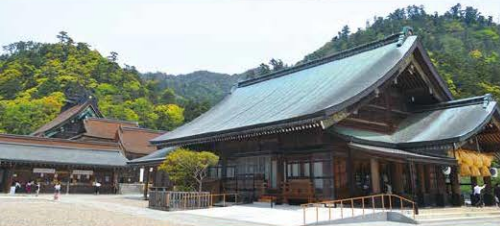
▲出雲大社 拝殿・本殿(イメージ)

世界遺産姫路城、国宝松江城、大国主大神を祀る出雲大社、 日本美の粋を極める足立美術館に風と砂の芸術品鳥取砂丘 をめぐる見ごたえのある贅沢な3日間です!!