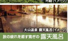
大山温泉 露天風呂(イメージ)