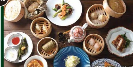
桂花苑 / ディナー(イメージ)

夕食のレストランの席には限りがございます。ご希望される夕食のレストラン、食事希望時間はご予約時にお知らせください。満席の場合、ご希望のレストランが選択できない場合がございます。予めご了承ください。