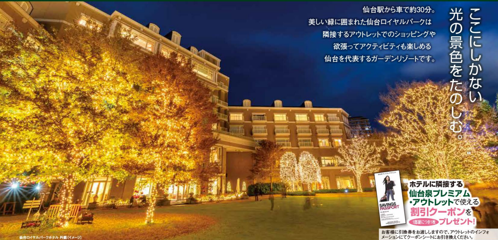
仙台ロイヤルパークホテル 外観(イメージ)

お1人様 旅行代金 1泊 2食(朝食1回・夕食1回)付 16,400円~26,300円 (スタンダードツイン:2名1室利用 または) ラグジュアリーツイン:3名1室利用 全国旅行支援 適用後の代金は別紙「お支払い実額表」をご覧ください。