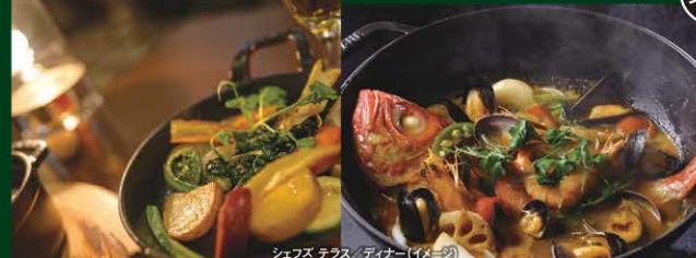
シェフズ テラス / ディナー(イメージ)