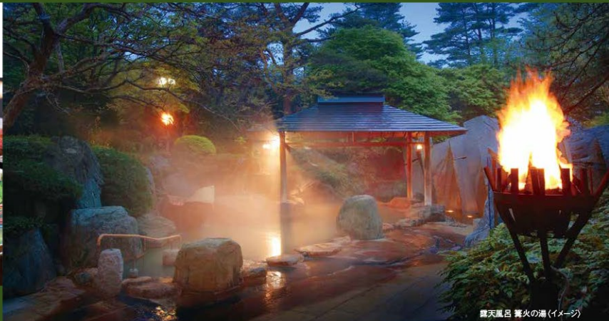
露天風呂 篝火の湯(イメージ)