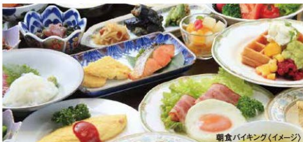
朝食バイキング(イメージ)

地のもの、旬のものを取り入れ、食材を最大限に生か した料理でおもてなし。調理長こだわりの厳選素材、 さらに緑水亭の庭園で採れた、たけのこや季節の山 菜が彩りを添えます。緑水亭が自信を持ってご提供 する四季の味を、心ゆくまでご堪能ください。