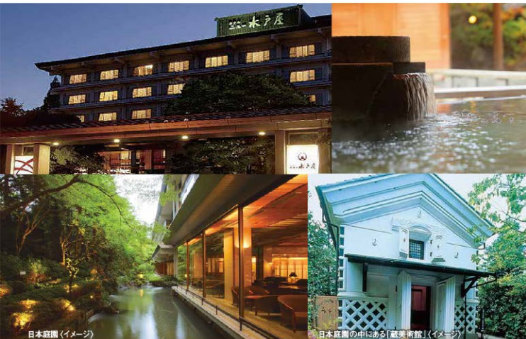
日本庭園(イメージ)

「また来たいね。」全てのお客様にそう思っていただけるおもてなしが、ホテルニュー水戸屋が目指すおもてなしです。