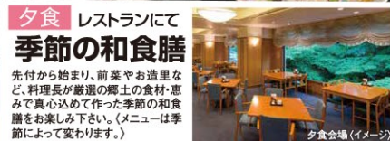
夕食会場(イメージ)

夕食 レストランにて 季節の和食膳 先付から始まり、前菜やお造りなど、料理長が厳選の郷土の食材・恵みで真心込めて作った季節の和食膳をお楽しみ下さい。(メニューは季節によって変わります。)