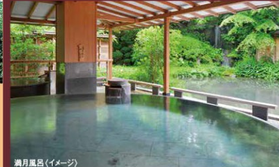
満月風呂(イメージ)