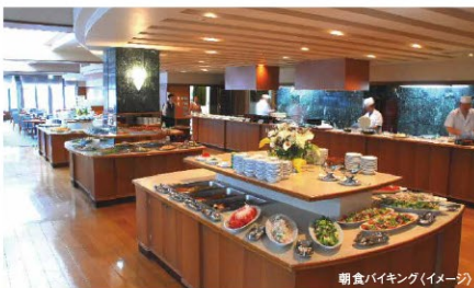
朝食バイキング(イメージ)

賑やかな笑顔が行き交う集いの時間を彩る海の幸・山の幸…。自然の恵みを丁寧にまごころ込めてお造りした旬を楽しむお料理をご賞味ください。