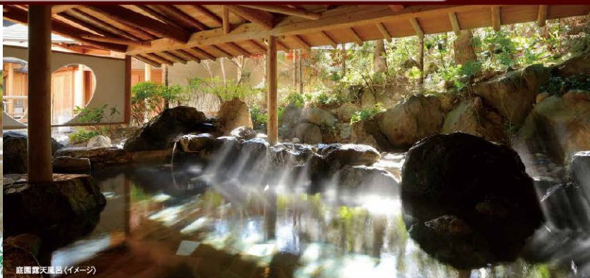
庭園露天風呂(イメージ)

客室やロビーから眺められる中庭は、四季折々の表情を眺めることが出来る日本庭園。日本の陶芸界を代表する作家の秀作を十数点展示する「蔵美術館」もあり、心安らぐひとときをご提供いたします。