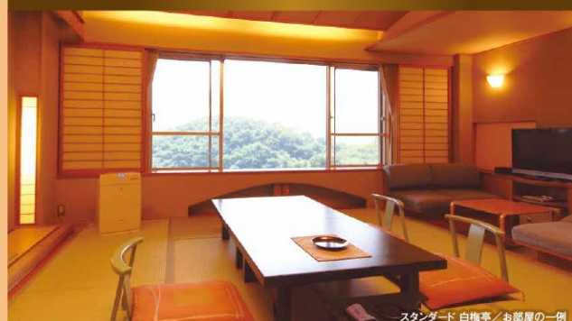
スタンダード 白梅亭 / お部屋の一例

ゆったりとした和の寛ぎあふれるお部屋は、ご家族からグループまで幅広くご利用頂けるスタンダードタイプのお部屋です。やすらぎの空間です※お部屋では土足厳禁です。お部屋着は、浴衣になります。(部屋指定なし)