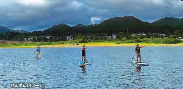
花山ダム(イメージ)