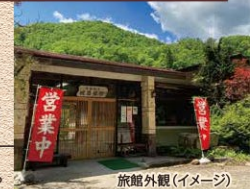
旅館外観(イメージ)