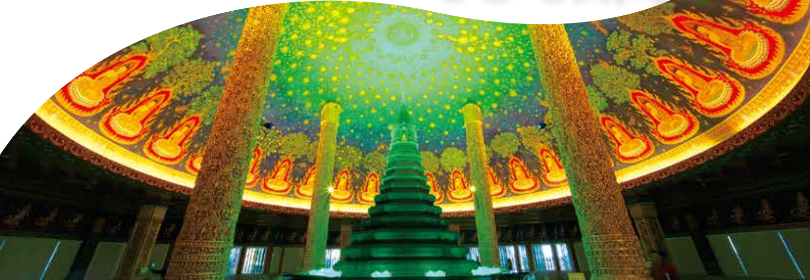
ワットパナム(イメージ)