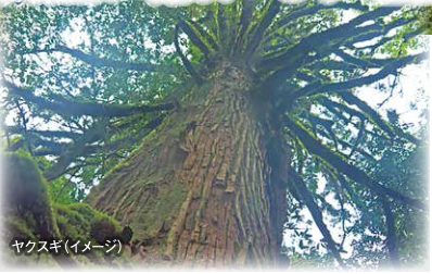
ヤクスギ (イメージ)