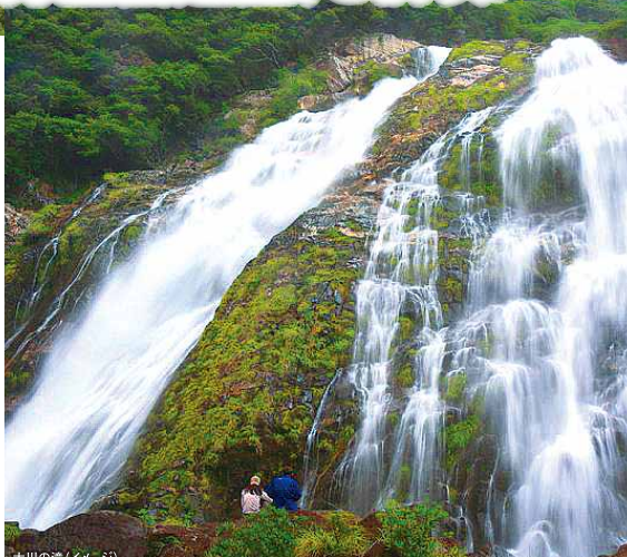
大川の滝 (イメージ)

標高約1,200メートルの安房林道沿いにある屋久杉です。樹高19.5メートル、胸高周囲8.1メートル、推定樹齢3,000年といわれています。