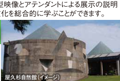
屋久杉自然館 (イメージ)