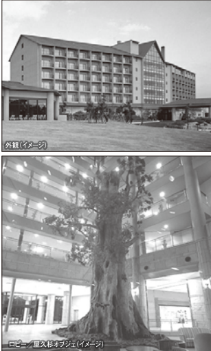
外観(イメージ) | ロビー/屋久杉オブジェ(イメージ)

世界自然遺産の島、屋久島。その新しいシンボルであることを象徴するように、屋久島いわさきホテルの高い吹抜のロビーには、屋久杉オブジェが堂々とそびえ、悠々の時間へ誘います。お部屋から望む大自然、木の香りとぬくもりにも癒やされる。近代的な設備とアメニティーを兼ね備えたラグジュアリーなホテルです。屋久島に包まれ雄大な山を望む。天然温泉「神の湯」も完備し、旅の疲れをゆったりと癒やすことができます。