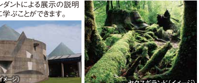
ヤクスギランド (イメージ)