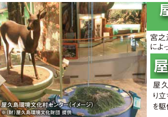
屋久島環境文化村センター (イメージ)

樹齢500年以上といわれる 巨大なガジュマル 樹齢500年以上といわれる巨大なガジュマルをはじめ、亜熱帯の植物が多く見られる屋久島最大のガジュマル公園です。