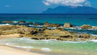
永田いなか浜 (イメージ)

花崗岩の白砂が約1kmに渡って続くウミガメの産卵地 永田川の流れに乗って屋久島の奥岳から運ばれてくる風化花崗岩の白砂。太平洋一円を回遊しながら生活するウミガメは、昔も今もここに上陸し、産卵を行います。