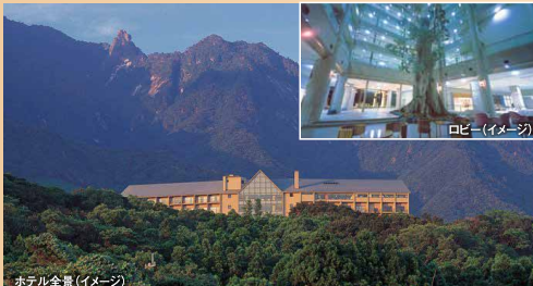
ホテル全景 (イメージ)

世界遺産「屋久島」の山懐に抱かれる近代的なリゾートホテルです。客室には屋久杉の家具がしつらえられ、悠々の時へといざなわれます。高い吹抜のロビーでは、屋久杉のオブジェが迎えてくれます。