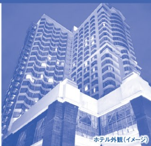
ホテル外観(イメージ)