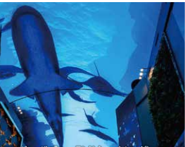
アンダー・ザ・ブルー・ランド・ショー(イメージ)