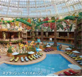
スプラッシュ・ベイ(イメージ)