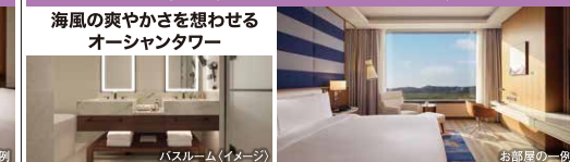
バスルーム(イメージ)