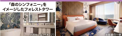
バスルーム(イメージ)