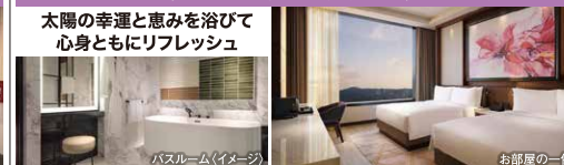
バスルーム(イメージ)