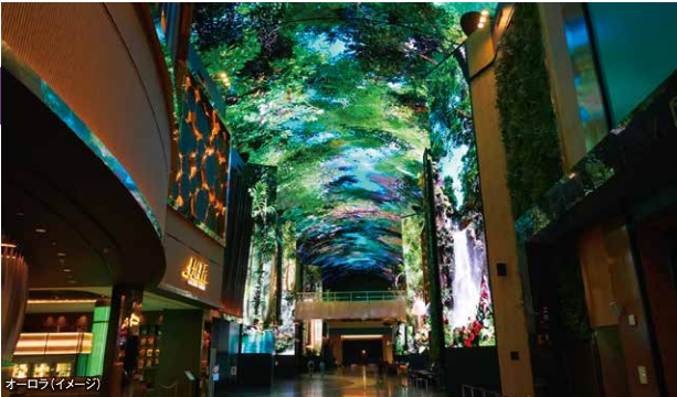
オーロラ(イメージ)