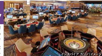
インスパイアカジノ(イメージ)

約150卓のゲームテーブルと約 390台のスロットマシン、160席の 電子テーブルゲームが2つのフロア に広がっています。オリジナル高級 広東料理レストラン「インスパイア」