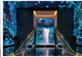
インスパイア エンターテインメント・リゾート(イメージ)