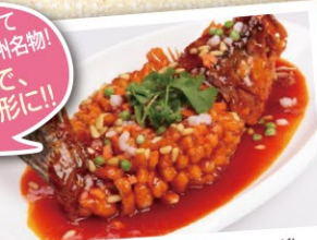
松鼠桂魚(ソンスユージュイユウ) (イメージ)

桂魚(ケツギョ)を揚げて 甘酢あんをかける蘇州名物! 見事な刀工で、 リスのような形に!!