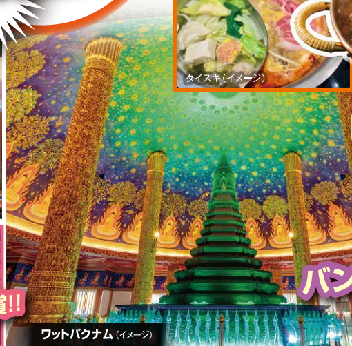
ワットパクナム (イメージ)