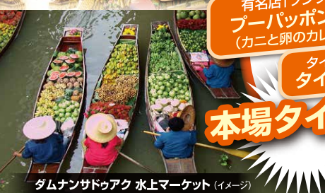
ダムナンサドゥアック 水上マーケット (イメージ)