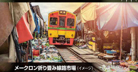
メークロン折り畳み線路市場 (イメージ)