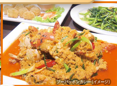
プーパッポンカレー(イメージ)