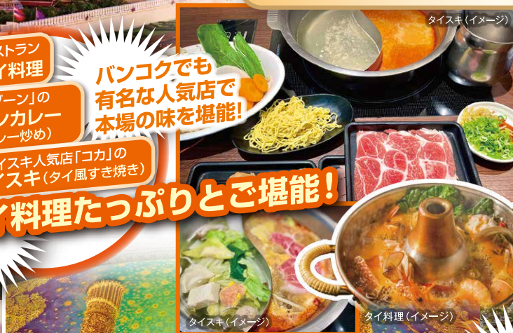
タイスキ(イメージ)