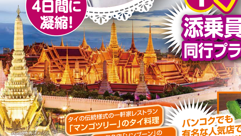
バンコク市内(イメージ)