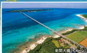
来間大橋 (イメージ)

無料で渡れる橋としては日本一の長さを誇る! 宮古本島と伊良部島を結ぶ橋。全長3,540m、2015年1月に開通。無料で渡れる橋としては日本一の長さを誇る橋です。