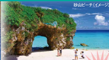
砂山ビーチ (イメージ)