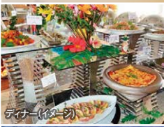
ディナー (イメージ)