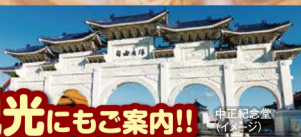
中正紀念堂(イメージ)