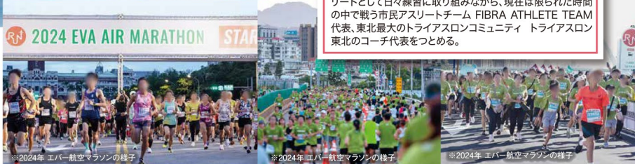
※2024年 エバー航空マラソンの様子